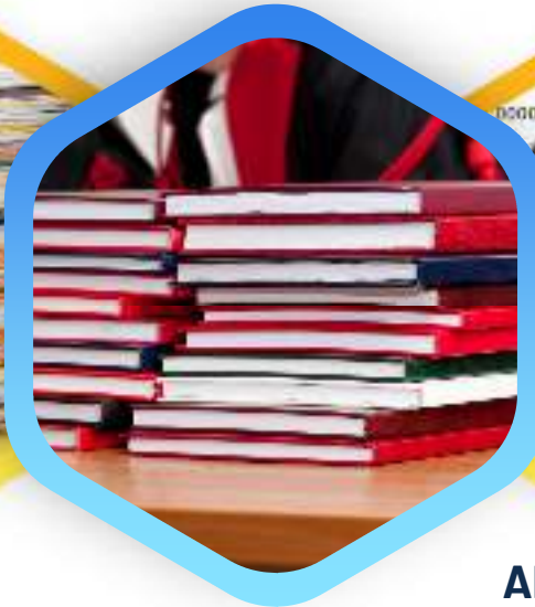
Karya ilmiah Skripsi, tesis, disertasi, LKP, Proposal penelitian