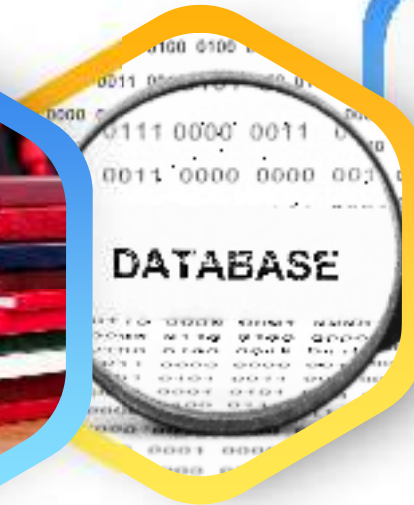
Akses database e- journal & e-book nasional dan internasional