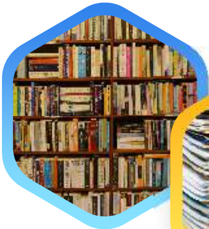
Buku Umum, fiksi