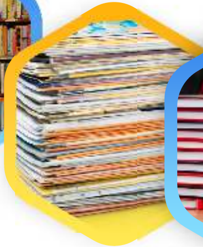
Serial Majalah, buletin, koran